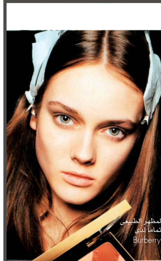
لمظهر الطبيعي تماماً لدى Burberry