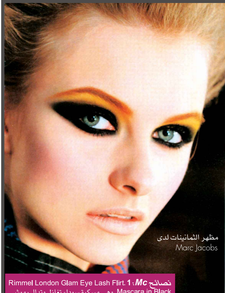
مظهر الثمانينات لدى Marc Jacobs