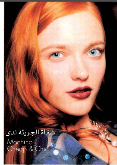
شفاه الجريئة لدى Mochino Cheap & Chic

بالتنوع من اللون الطوبى إلى لون التوت البرى تحتل الشفاه الجريئة المكانة الأولى ويظهر جمال الشفاه من استخدام مستحضرات (Giorgio) و (Dolce & Gabbana) وكذلك (Lanvin) الذين يقدمون لك أحمر الشفاه الأكثر إشراقاً وجاذبية وقوة، مع ترك العيون بدون مكياج وذلك للحصول على مظهر أكثر إثارة، مثل مظهر Debbie Harry-ish. وهذا ما يقدمه لنا خبير المكياج (Harry Brown) (Bobbi Brown) الذى قام بخلط أحمر الشفاه الأرجوانى اللون مع كريم أسمر اللون لدى مجموعة (Rachel Roy) ويضيف أيضاً المظهر ذو اللون الداكن مع إضافة للمعان الشفاف وذلك للتعبير عن الطبيعة.