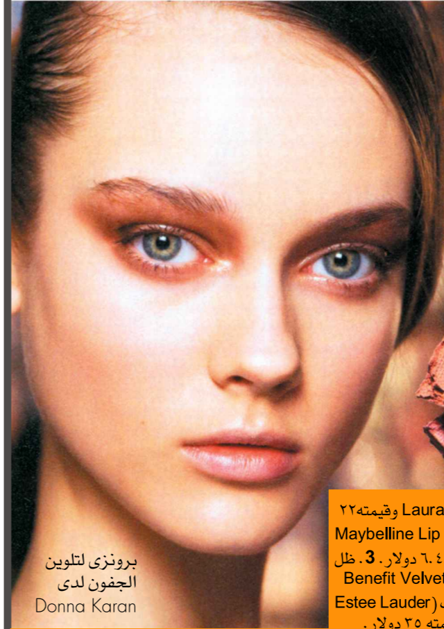
برونزى لتلوين الجفون لدى Donna Karan

نصائح Mc: 1. Laura Mercier Cheek Duo in Whisper. وقيمته 22 دولار. 2. مستحضر وملح الشفاه Maybelline Lip Gloss in Born With Sandstone Shimmer and it. وقيمة كلا المستحضرين 6.49 دولار. 3. ظل العين المخملى اللون (Benefit Velvet EyeShadow in 1 Cannes & I) وقيمته 19 دولار. 4. ظل العين ذو اللون الوردى المذهب (Estee Lauder Signature Eyeshadow Quad in Rose Gold) وقيمته 25 دولار.