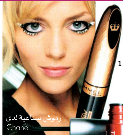
رموش صناعية لدى Chanel

نصائح MC: 1. Rimmel London Glam Eye Lash Flirt Mascara in Black وهي مسكرة سوداء تغازل وتدلل رموش عينيك وقيمتها ٧.٢٥ دولار. ٢. Fiberwig Tiny Sniper Mascara وهي مسكرة ذات شعيرات صغيرة للرموش الصغيرة قيمتها ١٥ دولار.